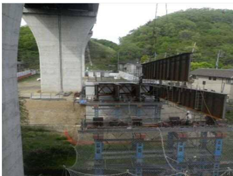
橋桁をボルトでジョイントしながら、橋台～橋台まで到達させていきます。