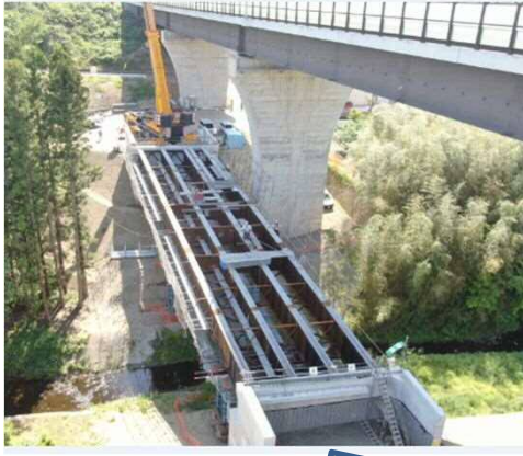
橋桁の架設が、完了しました。