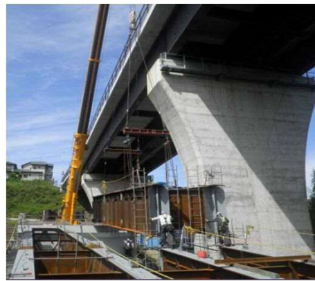
最終ブロックの架設状況です。