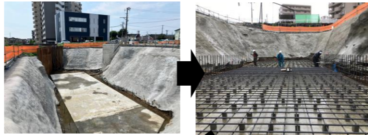
掘削・法面保護完了