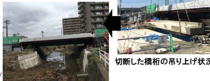
切断した橋桁の吊り上げ状況