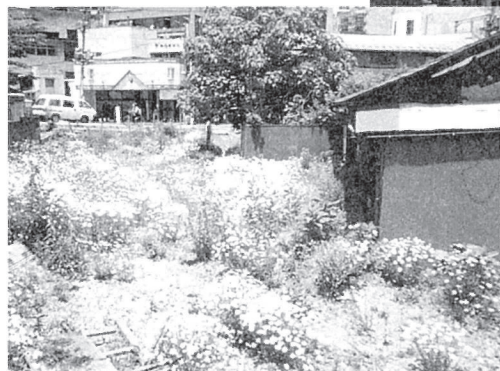
空き地がお花畑に変身