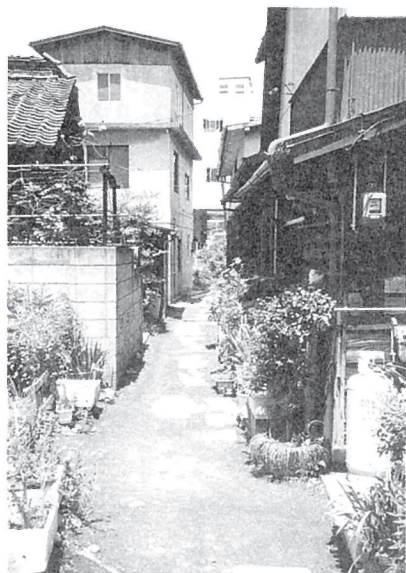
「通してけさえーん」の聲が聞こえてきそうだ