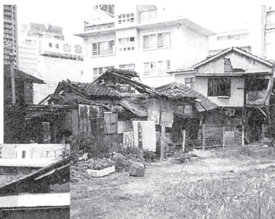
主のなくなった長屋