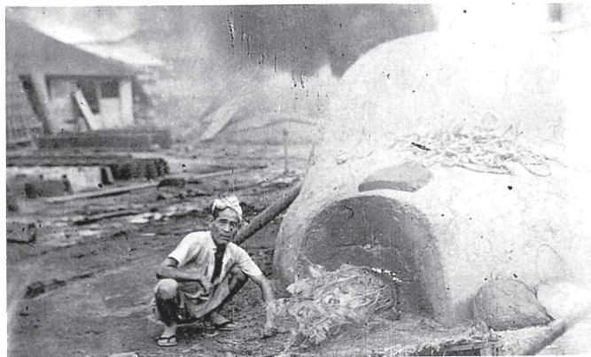
高野瓦屋さんの窯