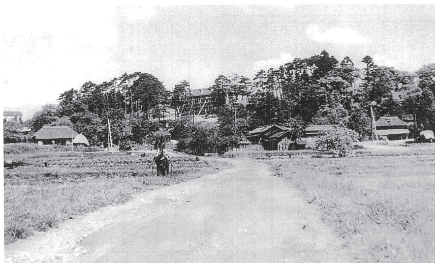
昭和23年の東仙台駅前から御立場を望む

壁が落ちる、屋根瓦が飛ぶ、道路が割れた（一丁目）、瓦が波打っていた、土台がずれた、サッシが外れた（二丁目）、水道・ガスが止まる等、大被害がありました。地震をきっかけに屋根を軽くしようという機運も出てきました。