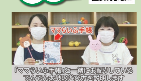
「ママらいふ手帳」と一緒にお配りしているでんでん太鼓の遊び方を説明します