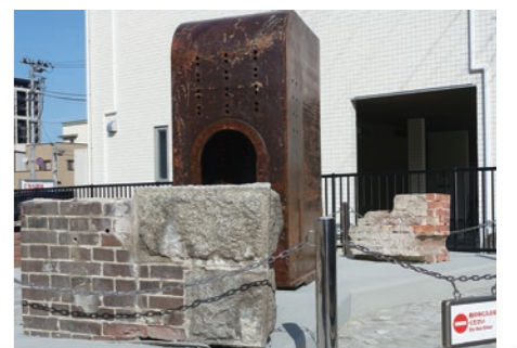
公園に設置されたX橋モニュメント