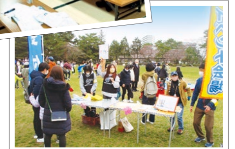
イベント当日は、約60人の児童が運営に参加