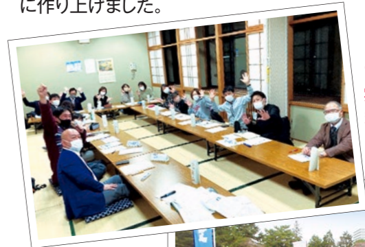
アイデアの実現に向け、多くの大人が協力!

榴岡小学校では、5年生が「榴岡公園」を活用した地域活性化のアイデアを考えました。児童は榴岡公園を「憩う場」「ふれあいの場」「自然を感じる場」と考え、キッチンカーのカフェスペースの設置、植物クイズやスタンプラリーの実施などを提案しました。それらの提案を実現するために、仙台駅東まちづくり協議会や学校支援地域本部、父母教師会などの地域団体で話し合いを重ね、「見せよう!榴岡の地から(力)」と題した地域イベントを、児童と一緒に作り上げました。