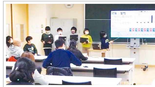
地域の皆さんに5年生が榴岡公園活用のアイデアをプレゼン!

宮城野区中央市民センターでは、小学校と連携した事業「町の未来をえがこうプロジェクト」を実施しています。この事業は、市民センター職員が地域の魅力や課題、特色のある取り組みなどの情報を児童に提供して「まちづくり」のアイデアを考えてもらい、市民センターや関係団体の協力によりそのアイデアを実現していくものです。学校の授業づくりに地域が参画する機会を創出することを目的としています。学校と地域のコーディネート役は、小・中学校から宮城野区中央市民センターに出向している3名の社会教育主事が担当。令和4年度は、4つの小学校と連携しました。