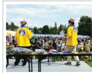
宮城野ウルトラクイズ!