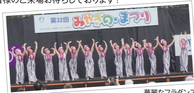
華麗なフラダンス

令和5年度の「みやぎの・まつり」は、11月5日(日)9:40~15:00に榴岡公園で開催予定です!今年は、コロナ禍以前の形式に戻したまつりを予定しており、露店コーナーやポッポ列車など昨年中止としていたコーナーも復活させ、さらに楽しいおまつりにできるよう準備を進めています。皆様のご来場お待ちしております!