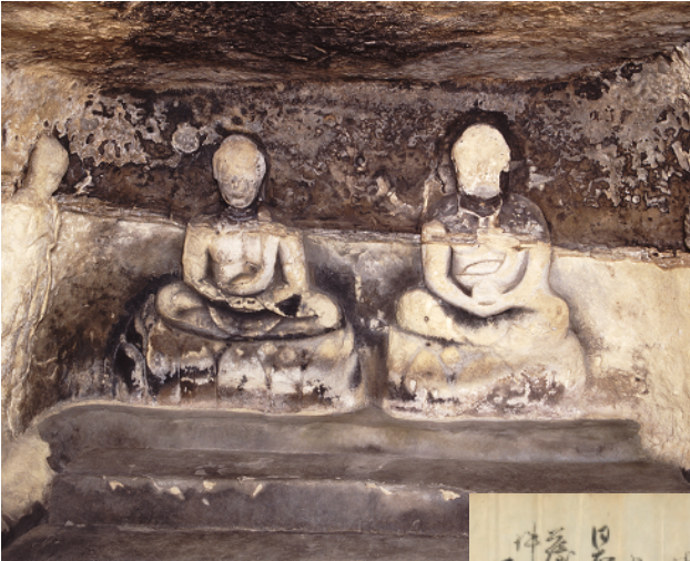
東光寺磨崖仏(レプリカ) 仙台市博物館蔵