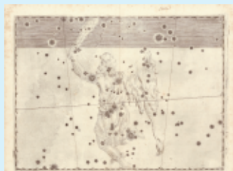
星座帳 ヨハン・バイエル著 1603年刊 天理図書館蔵