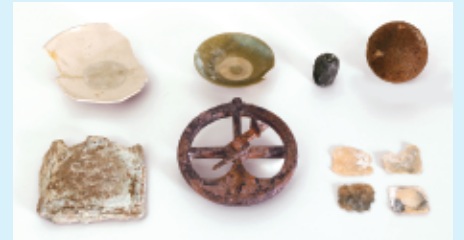
ポルトガル船マードレ・デ・デウス号引き揚げ資料 慶長14年(1610)長崎沖沈没天理参考館蔵