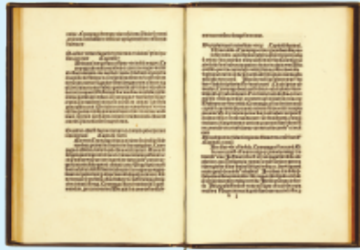
東方諸地域の慣習と状況に関する書 1484年頃刊 天理図書館蔵

ウエネツアアの商人である父とともにシルクロードを渡ったとされるマルコ・ポーロは、ヨーロッパに東洋の物語を伝えました。それは『東方見聞録』という一冊の書物の形をとり、多くの冒険者たちがこの本を手がかりに大海原を渡り、大航海時代を切り開きました。 この展覧会では、大航海時代へと時代が動く大きなうねりと世界の広がりを、天理大学附属天理参考館・天理図書館の所蔵資料から解き明かしていきます。