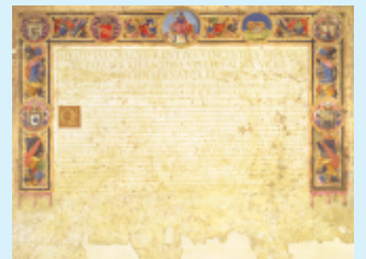
国宝「慶長遣欧使節関係資料」・ユネスコ「世界の記憶」 左上:支倉常長像、右上:ローマ教皇バウロ五世像 下:ローマ市民権証書 (7/23~8/25展示) すべて仙台市博物館蔵