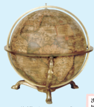
地球儀 カスハル・フォヘル作 1536年製 天理図書館蔵