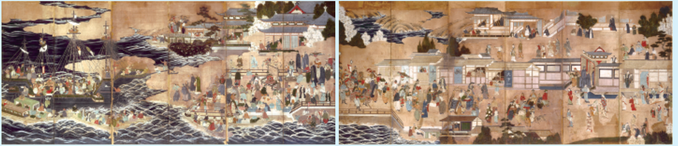
南蛮屏風 江戸時代初期(17世紀) 天理図書館蔵