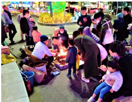
たき火会場では、火を見る機会が減ったお子様を中心にマシュマロ焼を体験