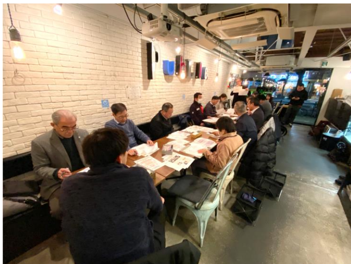
12月19日(火) 見えてきた今後の方向性に“長町の旧国道4号沿線らしさ”を加えるためには？参加者の皆さん一人ひとりが考えました。

この案は、3月に予定しているシンポジウムで地域の皆様にお示しし、ご意見をお聞きしながらさらにまとめていく予定としています。