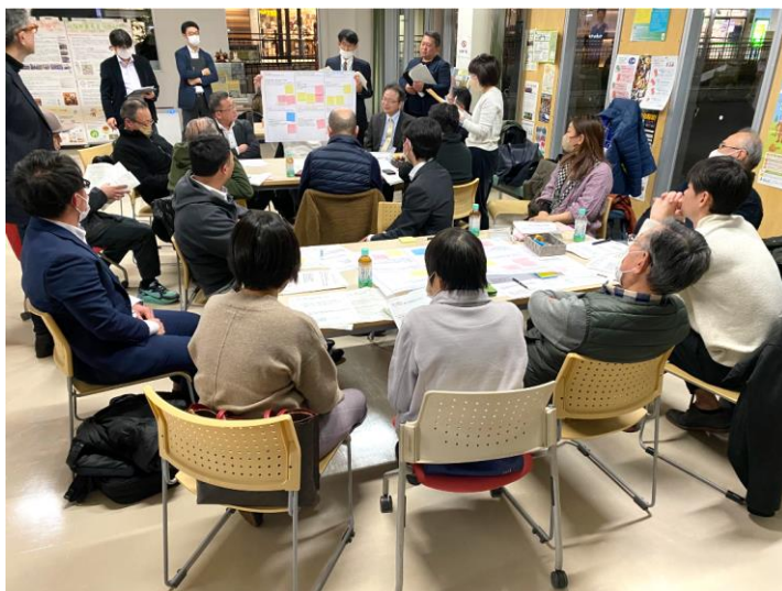
1月16日(火) 約20名のメンバーが活発な議論を交わし、班ごとに発表を行いました！