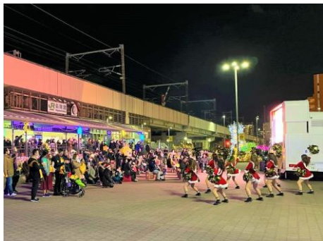
パブリックビューイングとクリスマスパフォーマンスで賑わう長町駅西口広場