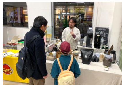
文字集め企画参加者に長町駅前プラザでホットドリンクを提供