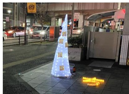
軒先利用の協力をいただき設置した「光のツリー」と「光の文字」

この実験では、文字集め企画参加者へのヒアリングの他、光のツリーをご覧になった人数の把握や歩行量調査(23日及び24日)を実施しました。その結果、 長町駅前だけでなく長町三丁目の方へも人が回遊したこと、同じくホームゲームが開催された翌24日(日)よりも商店街方面に足を運んでくださった方が1.5倍ほど多かった ことが明らかになりました。このことから、 目的となる仕掛けや目的地的があることで、旧国道4号沿線に人を誘導できる ことが確認でき、今後の街並みづくりのヒントになる取組みとなりました。