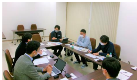
ヒアリング調査の様子

調査の中で頂いたご意見は、街並みの将来ビジョン作成の他、今後具体的な取組みを検討するにあたり活用させていただきます。