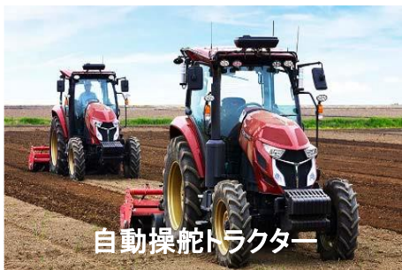
自動操舵トラクター