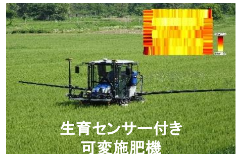
生育センサー付き 可変施肥機