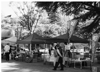
「仙台市旬の香り市」開催の様子

「仙台市旬の香り市」は、市民に新鮮な地場産農産物や農産加工品を販売することを通じて、仙台の農業を理解していただくために開催している直売会で、仙台市と市内の農業者等で構成する「仙台市旬の香り市実行委員会」が主催しています。