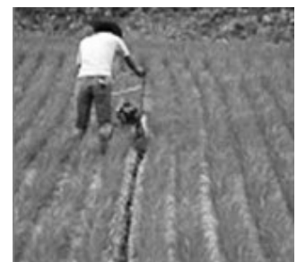
長期中干し(溝切り)

事業要件、交付単価などの詳細については、農林水産省ホームページ ( https://www.maff.go.jp/j/seisan/kankyokakyou_chokubarai/mainp.html ) をご確認ください。