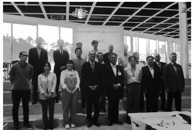
開講式終了後記念撮影