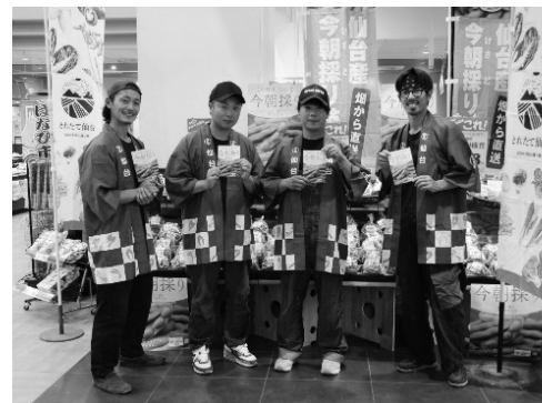
枝豆をPRする生産者グループ「レタスジャパン」