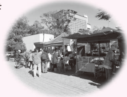
▲令和元年度「仙台市旬の香り市」の様子