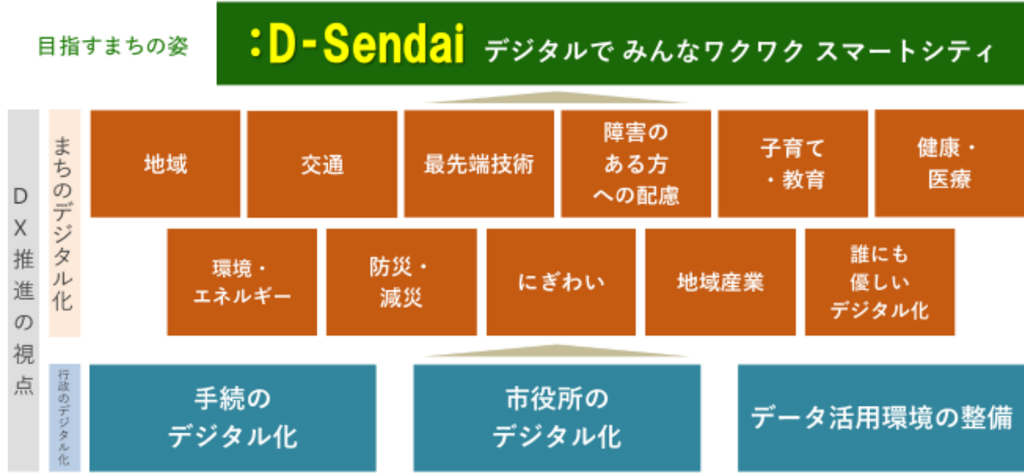
図 目指すまちの姿とDX推進の視点の関係