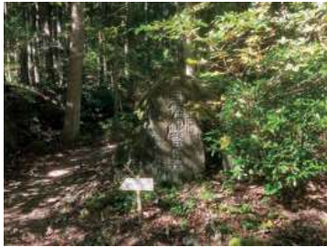
▲自然観察の森の入口

片 栗 の 咲 く 春 の 野 を さ ま よ い て 風 の 音 聞 く ヒ メ ギ フ チ ヨ ウ 待 ち 古 谷 隆 男