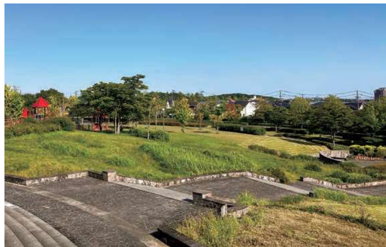
▲広々とした紫山公園

広場から丘の上につながる散策路も整備されており、林の中を歩くとちょっとしたトレッキング気分を味わえます。夏は涼しい木陰の中を、秋には美しく色づいた木々の下を歩いて楽しむことができます。