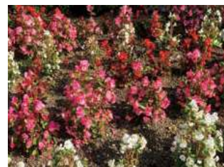
▲花壇に咲ききれいな花々