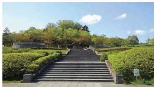
▲緑あふれる公園