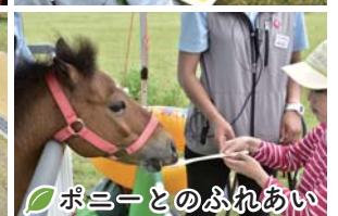
ポニーとのふれあい