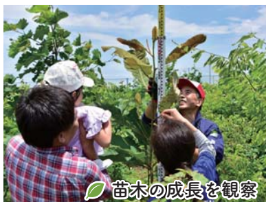
苗木の成長を観察