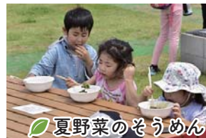
夏野菜のそうめん

海岸公園（井土地区）冒険広場で育樹会を開催しました。育樹作業で汗を流したあとは、五平餅と地元の「東六郷・東部かあちゃんず」が作った夏野菜のそうめんを食べました。午後からは冒険広場で遊びながらネイチャービンゴ大会を行いました。馬術場からポニーも遊びにきてくれて、子どもも大人も楽しんでいました。