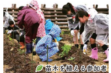
苗木を植える参加者

今回植樹した苗木は、緑の活動団体や市内の子どもたちが大切に育ててきたコナラやクヌギなど2,000本と、株式会社藤崎が用意したクロマツ2,000本の併せて4,000本です。雨合羽の彩り鮮やかな和気あいあいとした雰囲気の中、子どもも大人も協力して、丁寧に苗木を植えました。皆さまが愛情込めて育てた苗木は、恵みの雨を喜んでいるようでした。