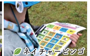
ネイチャービンゴ