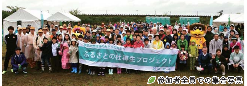
参加者全員での集合写真

6月15日(土)に若林区の海岸防災林(荒浜字南官林地区)で第9回植樹会を行いました。令和はじめの植樹会となった今回は、創業200周年を迎える老舗百貨店の株式会社藤崎と合同での開催となりました。