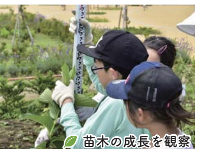
苗木の成長を観察

次回の育樹会は 8月31日(土) 10時～14時 海岸公園荒浜地区で開催します！