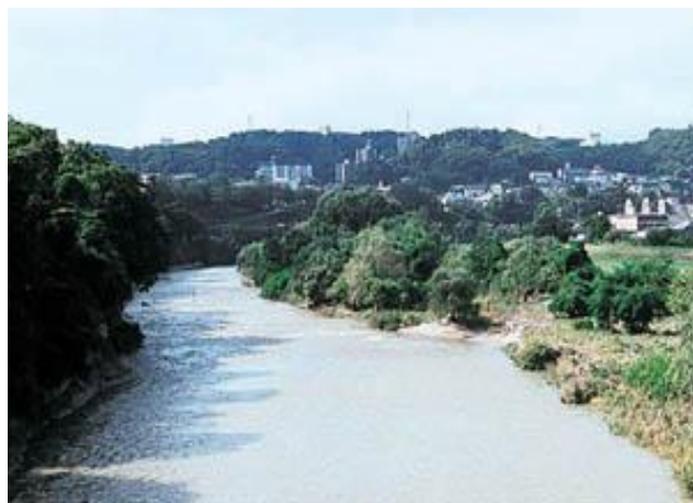
澱橋から上流の牛越橋方面を眺める