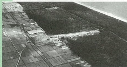
▲震災前の東部地域沿岸部