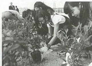
▲平成26年度市民植樹の様子 (高砂中央公園)