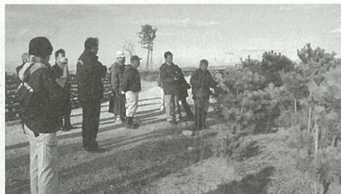
▲林野庁(「みどりのきずな再生植樹」)植樹場所視察の様子

当日は、まず3年前に林野庁が若林区荒浜地区で行った植樹の現在の状況や海岸公園蒲生地区の植樹会場の様子、宮城野区南蒲生地区の「みんなの居久根プロジェクト」の植樹現場を視察しました。