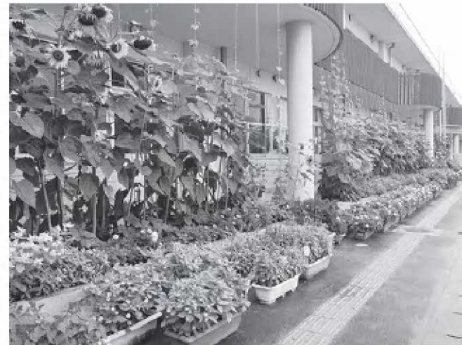
■優秀賞 『台原小学校』『高森中学校』 『柳生小学校』