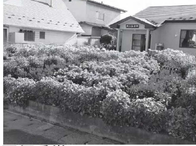
■優秀賞 『赤坂二丁目町内会』『北目町内会』 『福田町南一丁目公園愛護協力会』