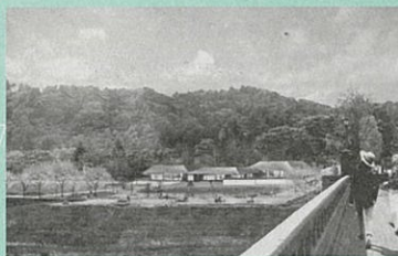
▲青葉山公園（仮称）公園センター イメージ

青葉山公園（仮称）公園センターは、平成29年12月からワークショップやデザインレビュー等公園センターの設計案を市民の皆さまと共に創り上げていくプレイスメイキングを行ってきました。