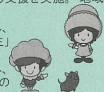
◎あしたのみどりキャンペーン

また、市民の皆さまとみどりを育む活動を広げていくことを目指し、あしたのみどり「植樹・花壇づくり支援」・わたしの好きな「みどりのある風景」の募集を実施します。