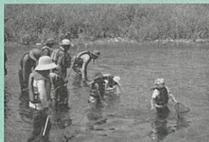
▲川遊びの様子 （平成29年）

毎月のプログラムは、ホームページでご紹介します。➡ www.sendai-op.net/market