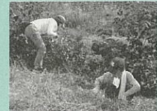
▲第5回育樹会の様子