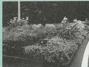
▲第54回「緑と花いっぱい花壇コンクール」入賞花壇

● 申込み (公財) 仙台市公園緑地協会(榴岡公園内)やグリーンハウス勾当台、七北田公園都市緑化ホールで配布する応募用紙より7月24日(火)までにお申込みください。(審査は8月に行います)