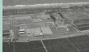
▲海岸公園（井土地区）の様子 （平成30年6月現在）

そして、このたび、井土地区に冒険広場・馬術場が完成し、いよいよ7年4ヶ月ぶりに海岸公園の全ての施設が利用可能となります。