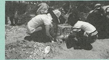
▲抵抗性クロマツを植樹する様子

これからは、苗木を育てる「育樹会」を開催する等市民の皆さまと共に「ふるさとの杜」を育ててまいります。