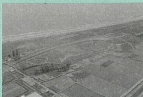
▲海岸公園（岡田地区）の様子 （平成30年5月現在）