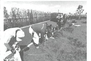
▲寄贈されたウバメガシの植樹