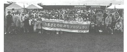
▲参加者全員での集合写真