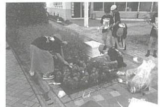
▲植付け作業をする児童たち