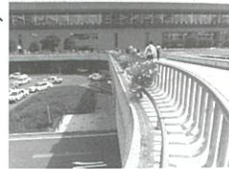
▲仙台駅前ペデストリアンデッキ