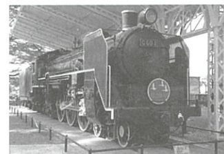
▲「はつかり」のヘッドマークを付けたC601