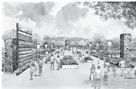
▲メイン会場となる青葉山公園入口のイメージ

■会場：メイン会場（青葉山公園追廻地区、西公園南側地区、広瀬川地区）、まちなかエリア会場（都心部の定禅寺通などの街路や公園）、東部エリア会場（震災遺構仙台市立荒浜小学校、せんだい3.11メモリアル交流館、せんだい農業園芸センターみどりの杜、海岸公園など）