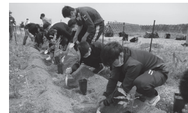
▲育樹作業の様子(6月11日)

5月18日(火)に東北学院高等学校3年生68名、6月11日(金)に28名が岡田地区の海岸防災林で育樹作業を行いました。作業の前に、地域の方々から震災での被害状況や地域の自然や歴史についてお話いただきました。