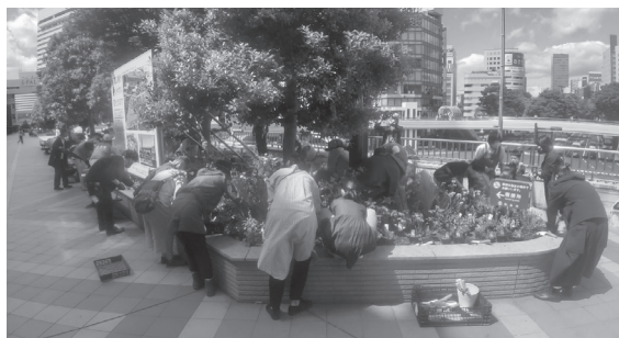
▲ペDESTリアンデッキ花壇での植栽作業

当日は、「季節と自然を感じられる、花のある風景の創出」と題して、バラやギボウシ、ハーブなどを、コロナ対策を行いながら参加者全員で植え付けました。