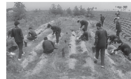
▲育樹作業の様子(6月6日)

6月6日(日)に仙台第一高等学校硬式野球部の生徒9名が荒浜地区の海岸防災林で育樹作業を行いました。昨年に続き、同地域に練習場があるため地域への貢献活動を行いました。