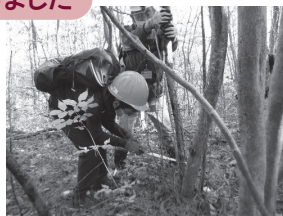
▲ノコギリを使い「枝打ち作業」を体験する参加者