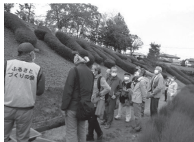
▲高森ふるさとづくりの会(左)の解説を聞く交流会参加者