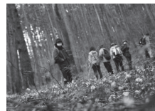
▲一面に咲くセリバオウレン (昨年3月撮影)