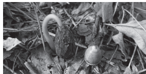
▲発芽したどんぐり

現在は、散策道も歩きやすくなり、下草刈りをしたことにより珍しい野草も増えてきました。今季はどんぐりが豊富で、発芽したどんぐりを苗木に育て、しっかり根がいたら植樹しようと計画しています。バードフィーダー(鳥のエサ台)作りにも初挑戦しました。餌付けが目的ではなく、自然の生態系を維持しながら野鳥を呼び寄せる効果を期待して行います。毎月第1日曜日の活動日には毎回新しい発見があり、みどりの生命力に感動しています。自然を残しつつ、人が手を入れることで維持される里山のバランスを上手に保ちながら自然保護活動を続けています。3月には自然観察会を予定していますので、詳しくは本誌裏面「ひやくもりとNEWS! イベント編」をご覧ください。