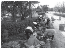
▲七北田公園での花壇づくり実習の様子

また、令和2年度に基礎講座を受講した1期生20名が、応用編となるステップアップ講座を受講しました。ステップアップ講座では、花壇のデザインや季節ごとの花壇の管理方法などを実践しました。11月24日に行われた修了式では、鎌田先生から1期生に修了証が手渡され、今後の活動を応援するお言葉が贈られました。ステップアップ講座修了後は、地域での花壇づくりや、全国都市緑化仙台フェアのウェルカムガーデンづくりの場などでの活躍が期待されます。