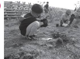
▲コナラの苗木を植える様子

11月2日に吉成小学校の3年生55名と、コナラなどの植樹と、ドングリから育てる苗木づくりを行いました。作業前に、防災学習として東日本大震災前の荒浜地区の状況や震災での被害状況を知ってもらい、海岸線の再生活動として「コナラ」「エノキ」「ヤマハンノキ」の3種類を楽しみながら植えました。苗木づくりではポットにドングリを埋めてもらいました。3年くらいで植樹できる大きさになる予定です。