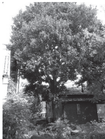
▲十二軒丁のしらかし