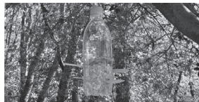
▲ペットボトルで作ったバードフィーダー