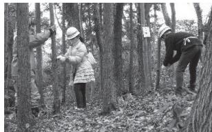
▲間伐体験をする幸町南小の生徒