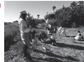
▲植樹を行う子ども達とベガッ太くん

今後は苗木を大きく育てるため、除草作業などが定期的に行われる予定です。活動情報はクラブホームページをご覧ください。