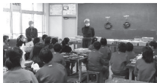
▲柞江小での授業の様子