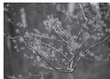
▲マンサクの花 (昨年1月撮影)