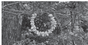
▲ピーナッツリースのバードフィーダー