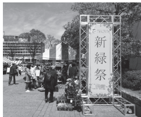
▲前回(平成31年度)の新緑祭の様子