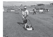
▲中河原緑地の草刈りの様子