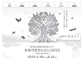
▲公式ホームページのイメージ