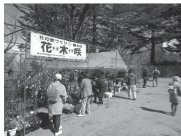
▲前回(平成31年度)の植木市の様子