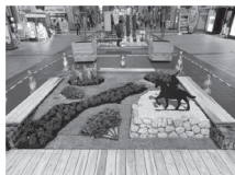
くまもとフェアに出展中の花壇▲