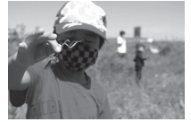
▲虫と遊ぼうの様子