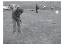
▲パークゴルフ練習の様子