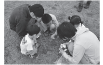
▲草花たんけんの様子