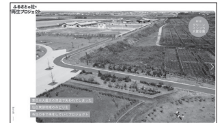
▲公式ホームページ