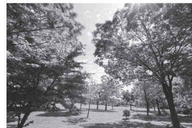
▲現在の名所100選の一つである七北田公園