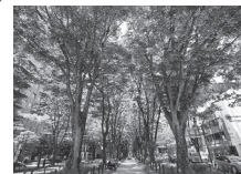
▲定禅寺通のケヤキ並木