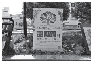
▲仙台駅ペDESTリアンデッキに設置されたカウントダウンボード

＜第40回全国都市緑化仙台フェア＞ 未来の杜せんだい2023～Feel green!～