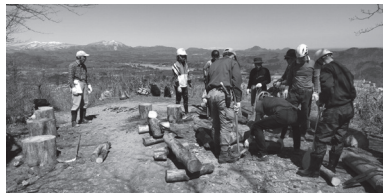
▲蕃山展望台（見晴台）のベンチ設置作業