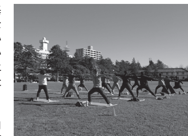
▲パークフィットネス（モーニングヨガ）の様子

この度、仙台駅東まちづくり協議会と連携し、榴岡公園にて新たな賑わいの創出とサービスの向上を図る社会実験を令和4年11月下旬まで実施しています。