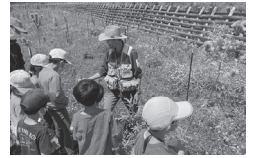
▲ミニイベントの様子