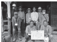
▲権現森自然研究会の皆さん

仙台市北部の権現森を拠点に自然観察会の開催や遊歩道の整備を行っているほか、地域の小学校の総合学習の支援や地域の町内会や保育所との緑の活動や市民センター主催行事の支援を行っている団体で、平成21年度に「仙台市緑の活動団体」として認定され、25名ほどで活動しています。権現森が与えてくれる豊かな自然を研究し、守り、いつまでも心に残る森であることを多くの市民に伝えることを目的に活動しています。林内には散策路が整備され、カタクリが咲く春から、落葉後の木立の間を通る小鳥を間近に感じる冬まで里山の様々な姿を楽しめます。権現森自然研究会の皆さんの活動により、この素晴らしい森が守られています。