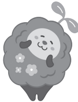
百年の杜づくりキャラクター フォレっぴ