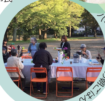
パークキッチンの朝ごはん

▶ MAIL enjoy2014wp@gmail.com ▶ ホームページ https://www.facebook.com/nishikouenr