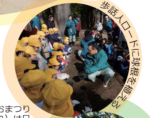
歩話人ロードに球根を植える