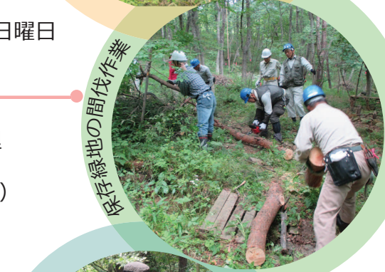
保存緑地の間伐作業