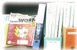
求人・職業訓練の情報提供