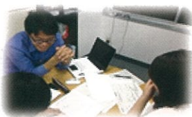
応募書類作成サポート

※当センターで独自の求人を持っていないため、直接お仕事を紹介・あっせんすることはできませんので、あらかじめご了承ください。