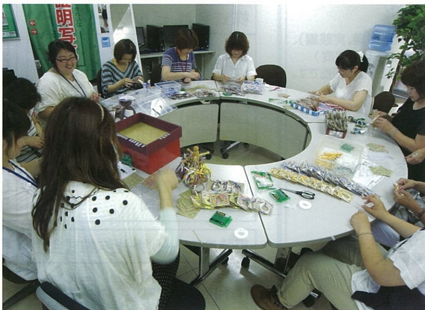
楽しみながらリボンレイ作りをする参加者たち＝青葉区二日町

ハワイの首飾りをモチーフにしたストラップ「ハワイアンリボンレイ」の納品会が8月3日、P