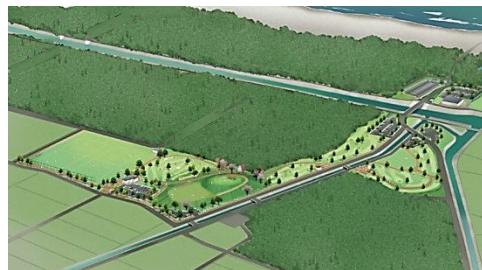
再整備イメージ図（上：蒲生地区 下：荒浜地区）