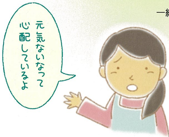
心配していることを伝える