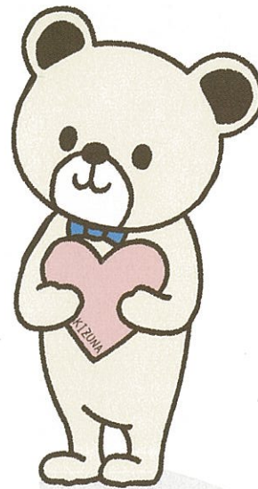
仙台市こころの健康づくり キャラクター 「ここまる」