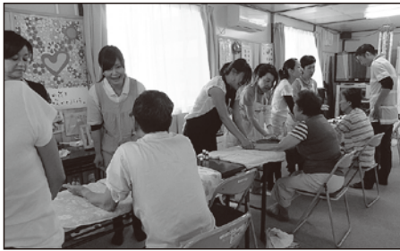
▲あすと長町仮設住宅集会場での施術のようす。敏感肌の方のことを考えて、天然由来のキャリアオイルを使用しています。

「共に歩く」という意味があります。セラピストには、「寄り添う」 あすと長町仮設住宅での活動を始めて2年、今日も集会場には顔なじみの住人が集まってくる。わいを見せています。 「お父さん、今日の体調はどう？」お母さん、今日は元気づけだね」ハンドケアが始まると、会場はまるで家族のような雰囲気になります。肌と肌が触れ合うことで生まれるコミュニケーションは、対話よりいっそう人と人との距離を近づけるのです。