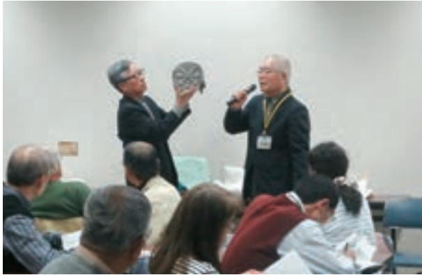
第1回 奈良・平安時代の瓦の説明

4月から全5回に渡り実施された本講座は、ガイドボランティア会の協力を得て、行われました。講座では、実際に遺跡から出土した、陸奥国分寺跡に関連する瓦を受講者の方々に見ていただきました。ガイドボランティアの方々からは、瓦の特徴などの説明もしてもらいました。また、「奥の細道」をテーマにした第4回では、ガイドボランティア会の方に講師を務めていただきました。