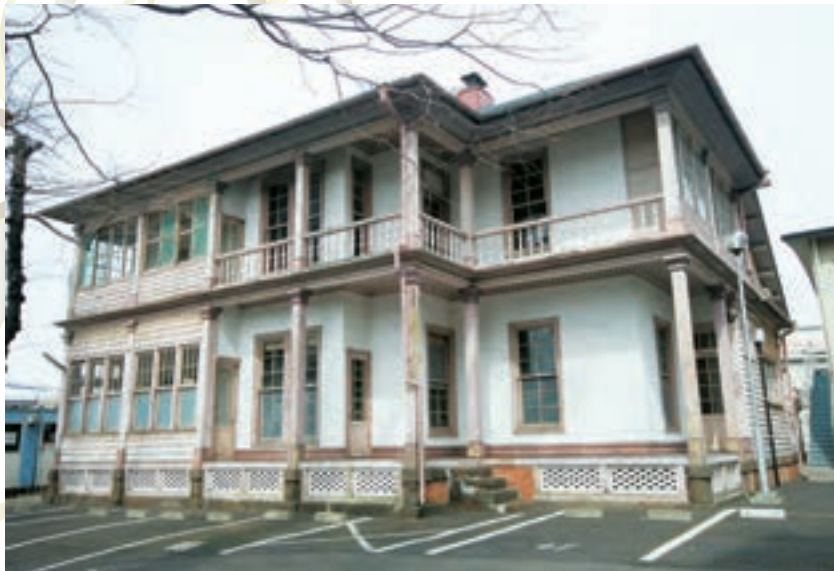
東北学院旧宣教師館

デフォレスト館は、明治20年頃に宣教師のために建てられた住宅で、東北学院土樋キャンパスの中にあります。平成25年3月に国登録文化財に登録されていましたが、「東北学院旧宣教師館」として、改めて、国の重要文化財に指定されることになりました。日本に残る外国人宣教師住宅の初期の事例として数が少なく貴重であり、高い歴史的価値を持つと評価されています。