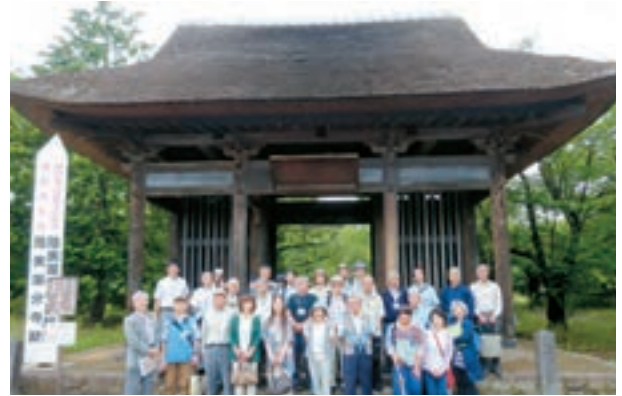
第5回 現地でのフィールドワーク