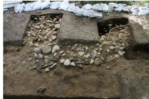
写真6 2区で見つかった集石(北から) 集石は少なくとも3.0×2.0mの範囲に広がっていることがわかりました。