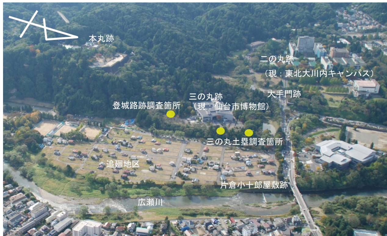
図1 仙台城跡空撮写真(東から撮影)

仙台城跡の整備に向けて、7月から巽門跡周辺の登城路跡と三の丸土塁で発掘調査を実施しています。登城路跡の調査は今回が3回目で、これまでに清水門から本丸詰門へ向かう登城路周辺の発掘調査や石垣の測量を行ってきました。今回の調査は、巽門跡周辺における登城路の位置と遺構の確認を目的に、特に、巽門跡西側の石垣が本来の登城路に沿ってどのように延びているのかを明らかにするために行いました。土塁の調査は、これまで三の丸東側の土塁を中心に行い、今回で5回目になります。今回の調査は江戸時代の土塁形状と塀などの痕跡を確認するため、三の丸東側土塁に2か所の調査区を設定しました。特に、三の丸東側土塁の北端の調査区は、絵図で土塀の表現が見られる場所です。