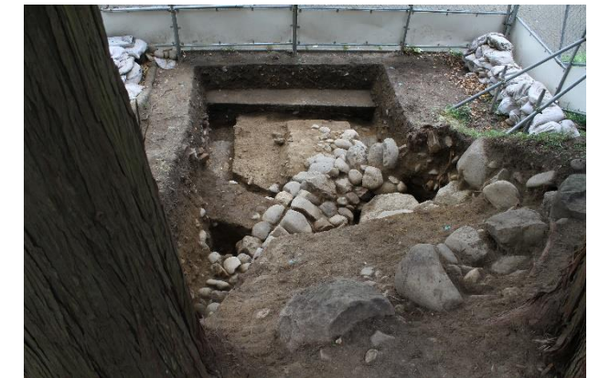
写真2 調査区全景(西から)