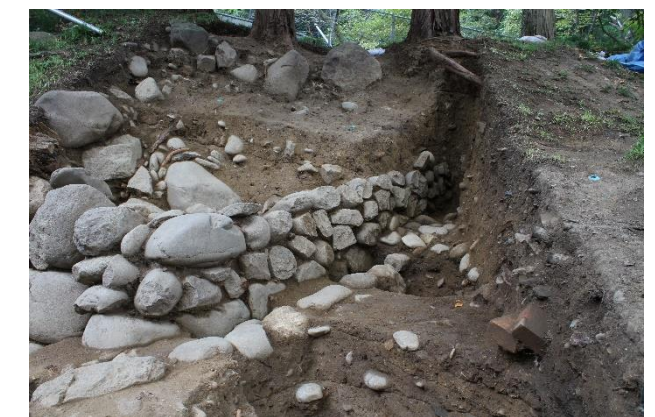
写真4 北西に延びる石垣の様子(東から)