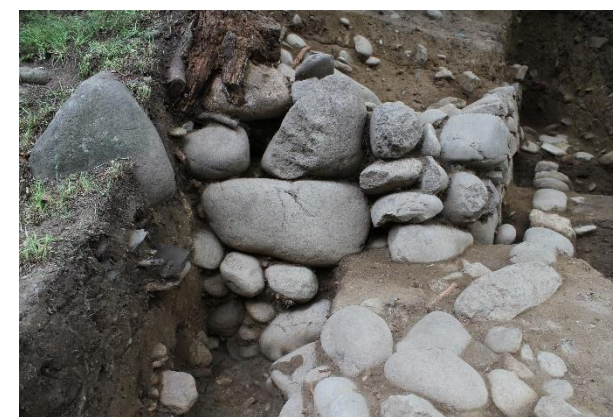
写真3 北に延びる石垣の様子(東から)