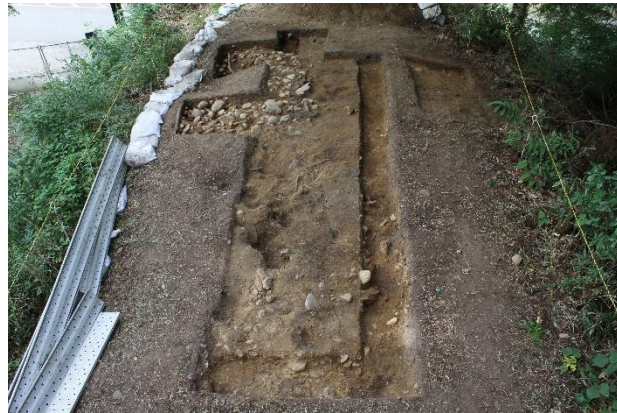
写真5 三の丸土塁2区の様子(東から) 写真手前側は、明治時代以降の掘削でいくつも穴が開き、盛土の上面がでこぼこしている。

また、2区の場所は、江戸時代の絵図で土塀の表現は見られる場所ですが、調査で土塀の痕跡が見つからないことは、三の丸東側の土塁が江戸時代に何度も修理(表1)される中で撤去された可能性を示していると考えられます。