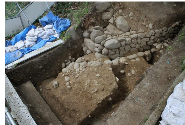
写真1 調査区東側の様子(北東から)

また、調査では熱で変形したガラスが多く出土しました。出土したガラスは、ほとんどがビール瓶や一升瓶で、周辺に捨てられていたものが、巽門が焼失した1945年の仙台空襲で溶けた可能性があります。変形したガラスは調査区の表層に厚く堆積する層から出土したので、戦後に調査区周辺で大規模な造成が行われた可能性があります。