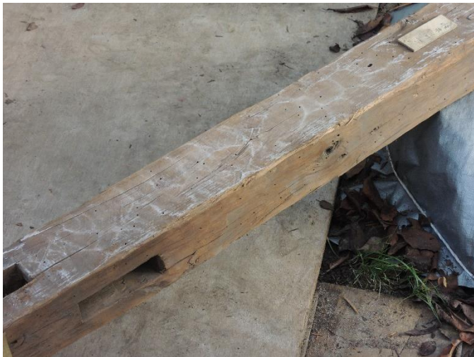
写真2 蛤刃チョウナの加工痕