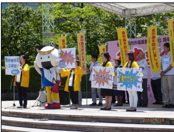
食肉まつりでの啓発活動