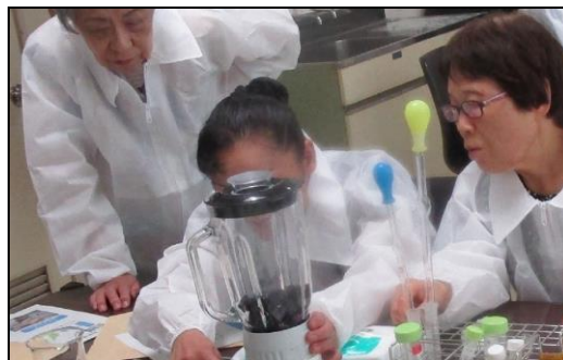
検査施設の見学会