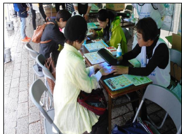
「正しい手洗い」の実験