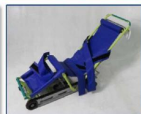
▲キャリダン(非常用階段避難車)