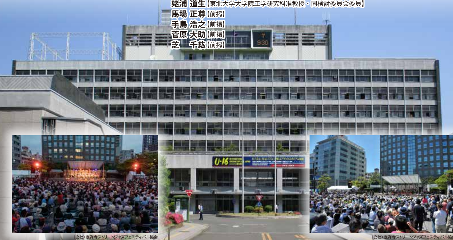
(公社)定禅寺ストリートジャズフェスティバル協会