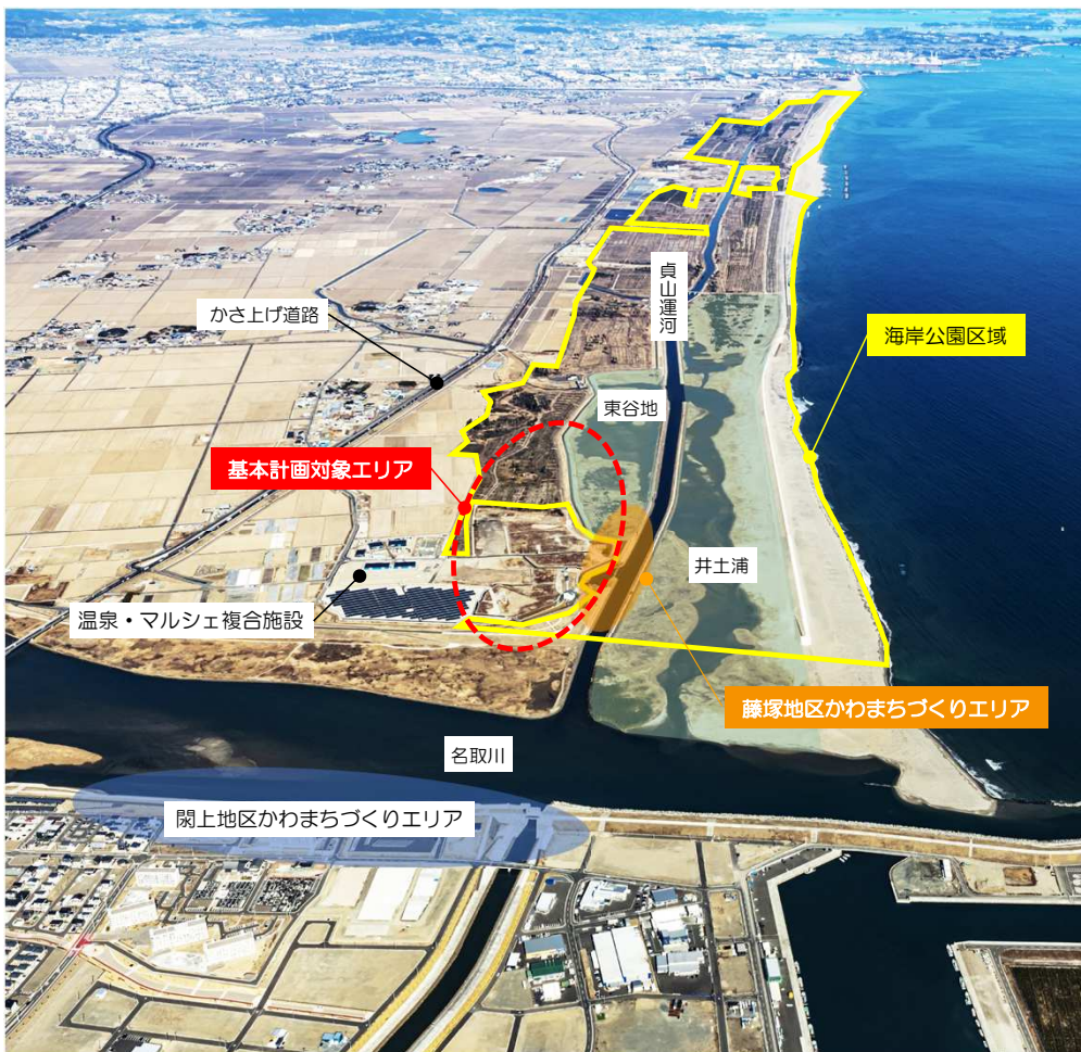
海岸公園（藤塚地区）基本計画の対象エリア

その整備にあたっては、国のかわまちづくり支援制度等を活用し、国や民間事業者と連携したにぎわい創出を検討しております。この度、地域の方々や関係自治体で構成された「藤塚地区にぎわいづくり検討会」での意見等をもとに、「海岸公園（藤塚地区）基本計画案」を取りまとめました。