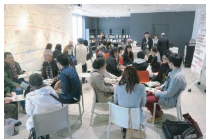
12月12～13日実施「3.11 オモイデツアー」