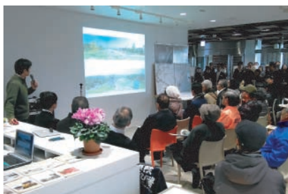
12月6日実施「開館キックオフミーティング」