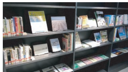
「3.11 震災文庫」(震災や地域関連資料など)