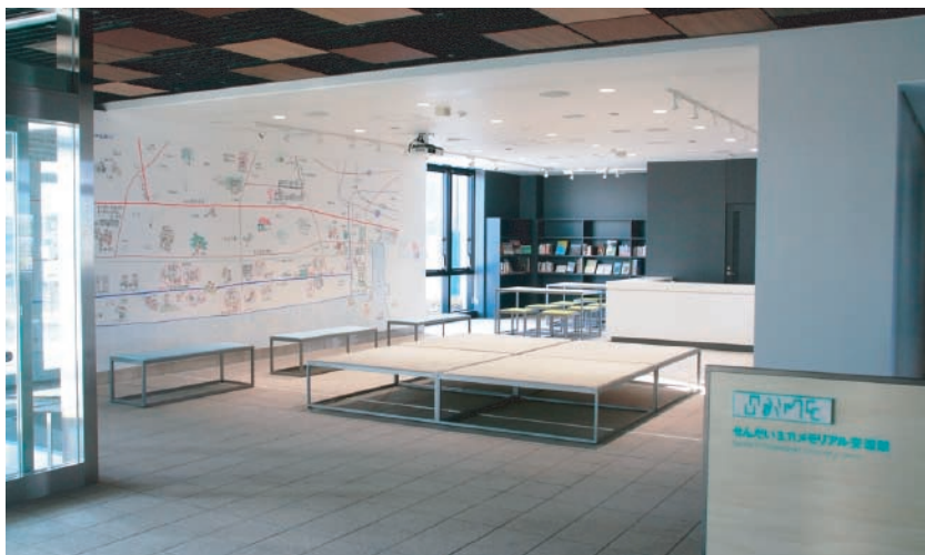
左手壁面には仙台市東部沿岸地域のイラストマップ