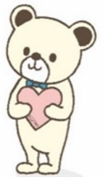
仙台市こころの健康づくり キャラクター「ここまる」

※ 説明・通所申し込みは、随時受け付けて おります。 ご希望の方はお問い合わせ下さい。