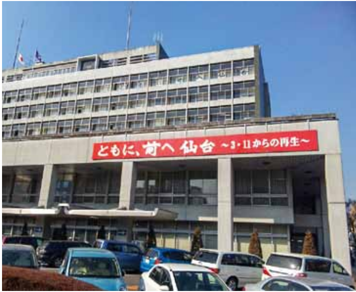
仙台市役所本庁舎