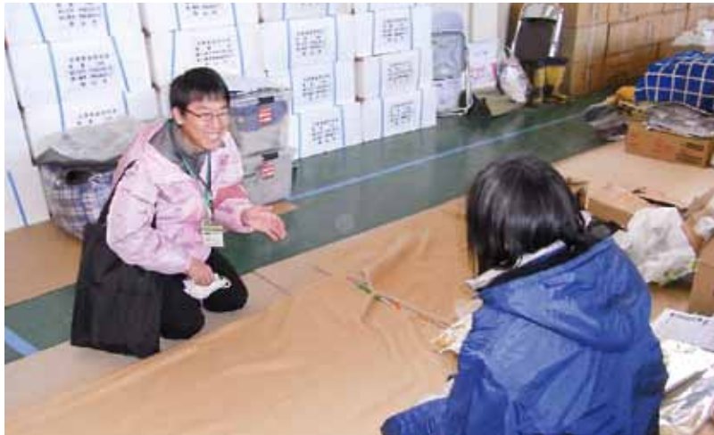
仙台市こころのケアチーム