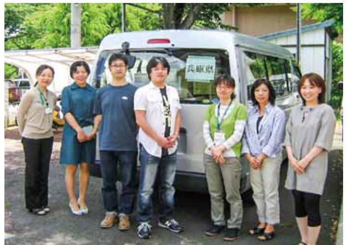
兵庫県チームと当センタースタッフ