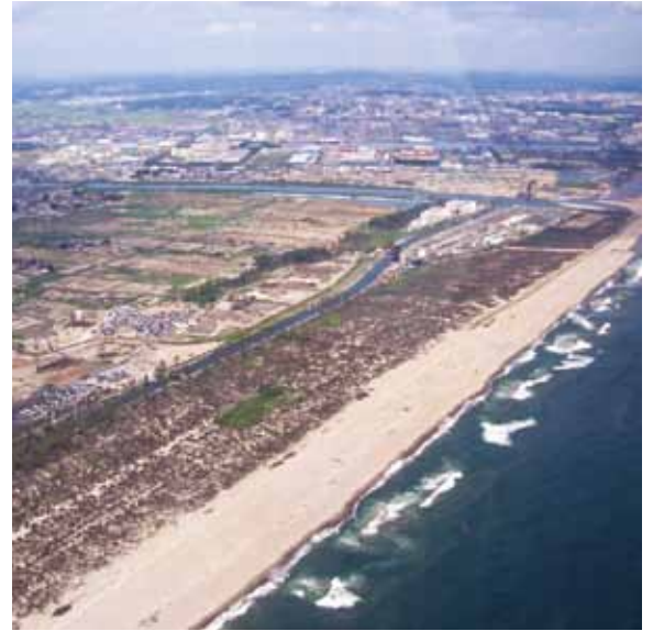
津波被害後の仙台市沿岸部