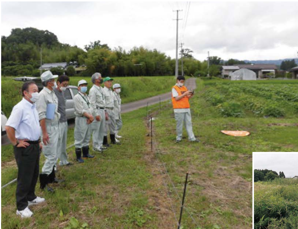
農地パトロールでドローンを操作する様子(青葉区芋沢)