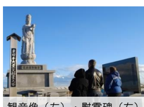
観音像(左)・慰霊碑(右)

震災で犠牲になった方々を追悼し荒浜を忘れないとの思いが込められた地域モニュメント「荒浜記憶の鐘」が設置されています。