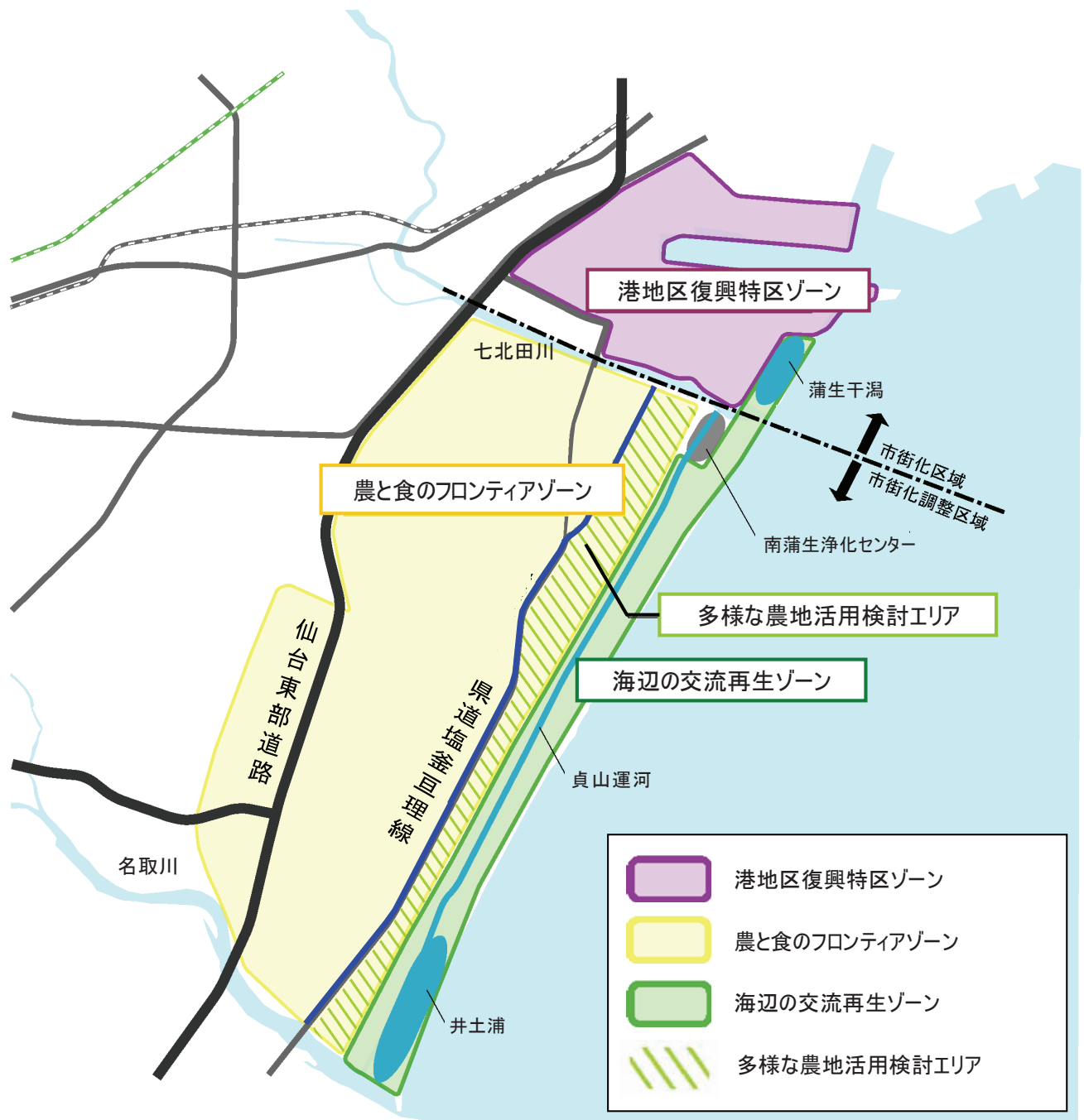
図3 東部地域の土地利用イメージ