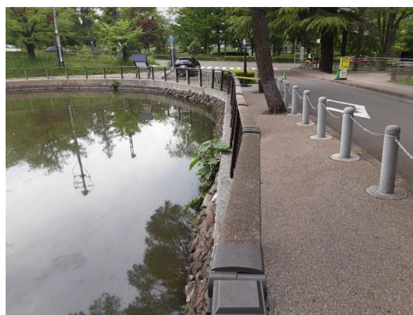
転落防止柵の傾斜