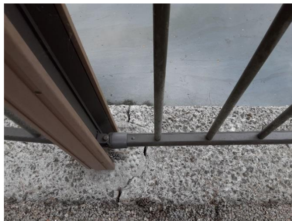
天端コンクリートひび割れ