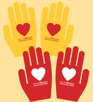
応援手袋は無料配布です

ゴール地点の弘進ゴムアスリートパーク仙台では、一般解放席をご用意しております。ゴール直前の選手に是非エールを贈ってください。みなさまのご来場をお待ちしております。