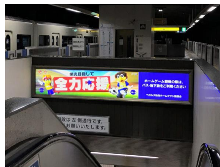
八乙女駅階段正面内照