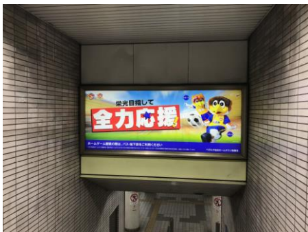
河原町駅階段正面内照