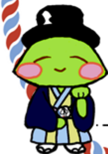
生出地域キャラクター おいでもん