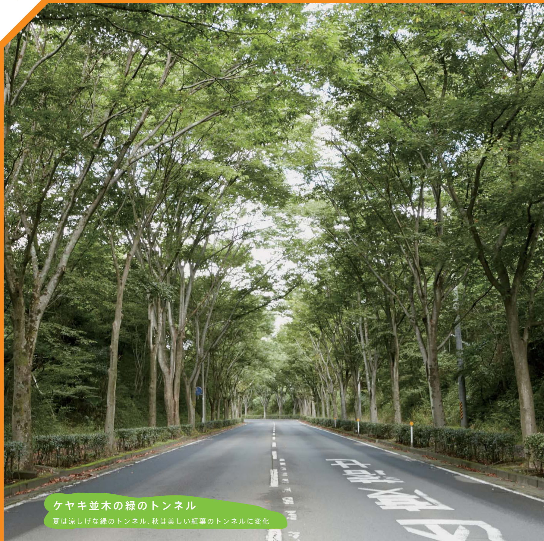
ケヤキ並木の緑のトンネル 夏は涼しげな緑のトンネル、秋は美しい紅葉のトンネルに変化