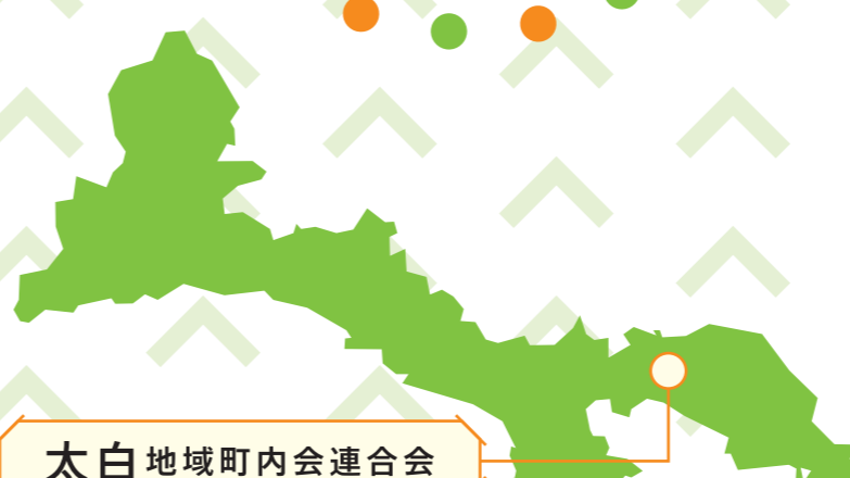
太白地域町内会連合会