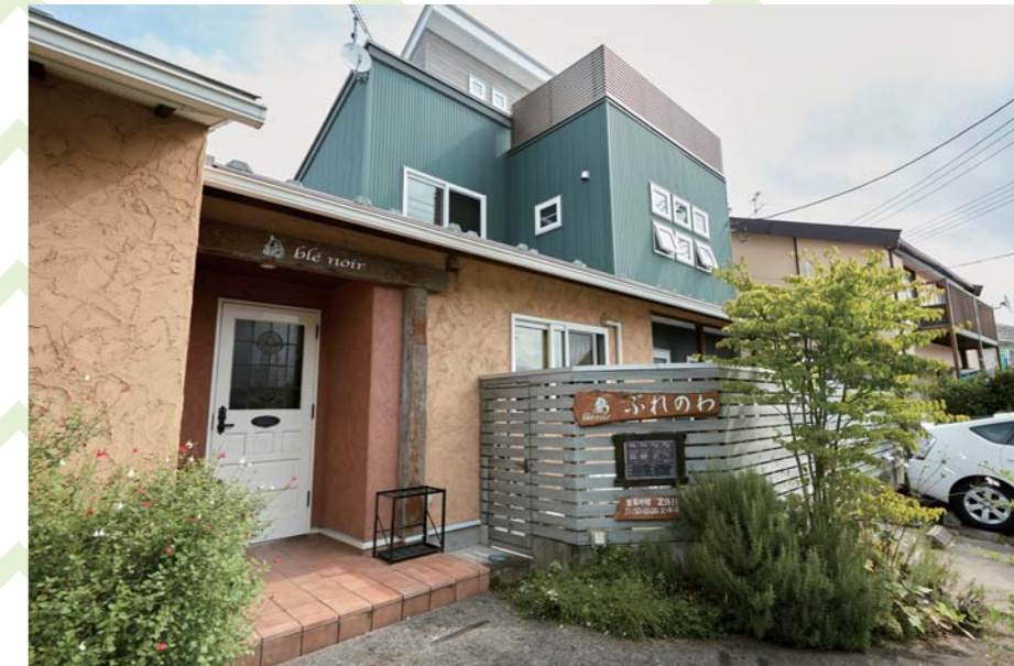
蕎麦キッチン あふれのわ: 味に定評がある手打ちそばとガレットのお店