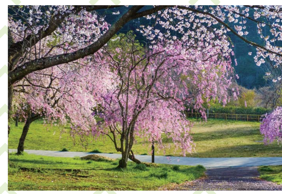
ひより台公園の桜: 約50本の桜が植樹されている