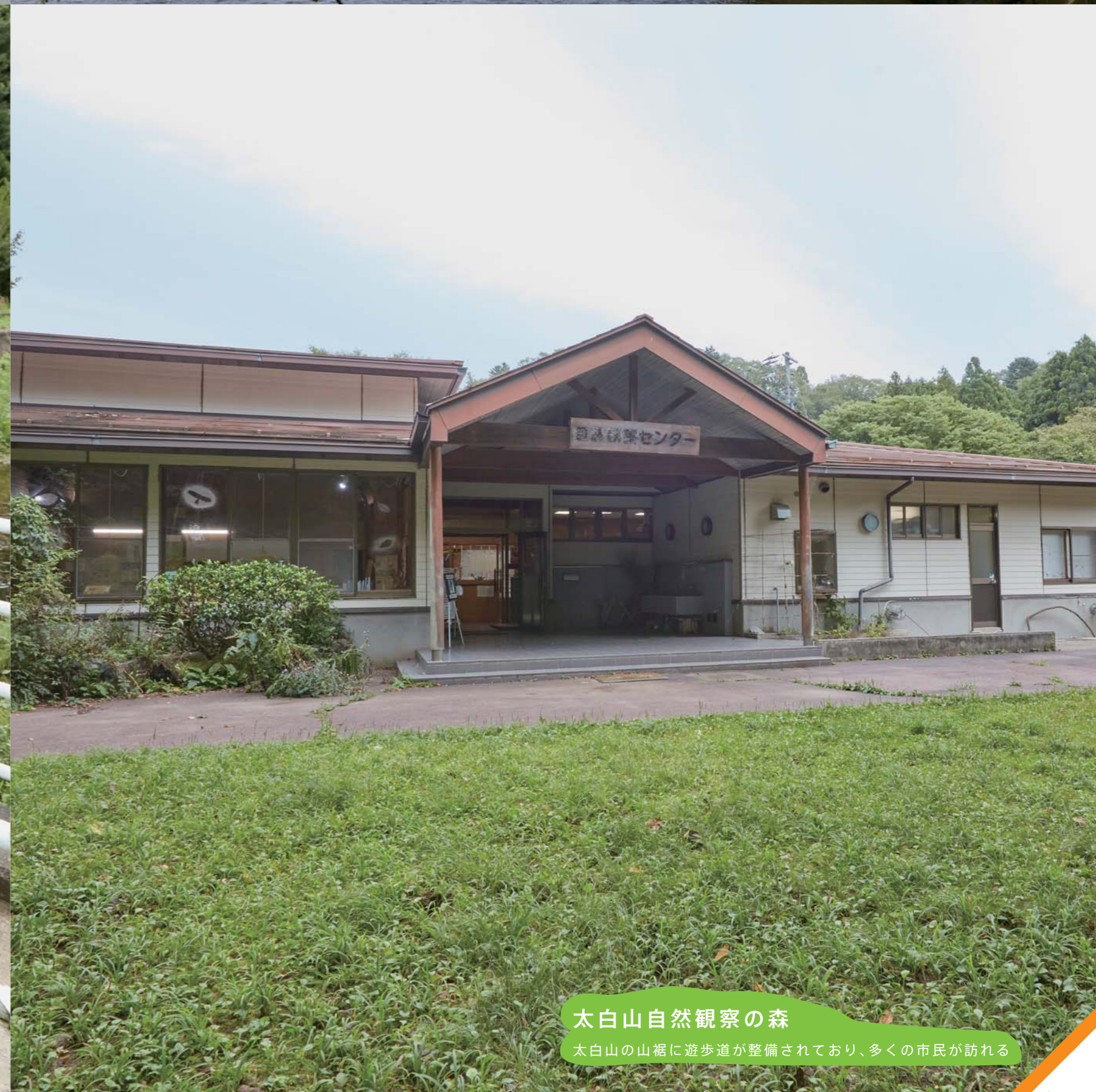
太白山自然観察の森 太白山の山裾に遊歩道が整備されており、多くの市民が訪れる